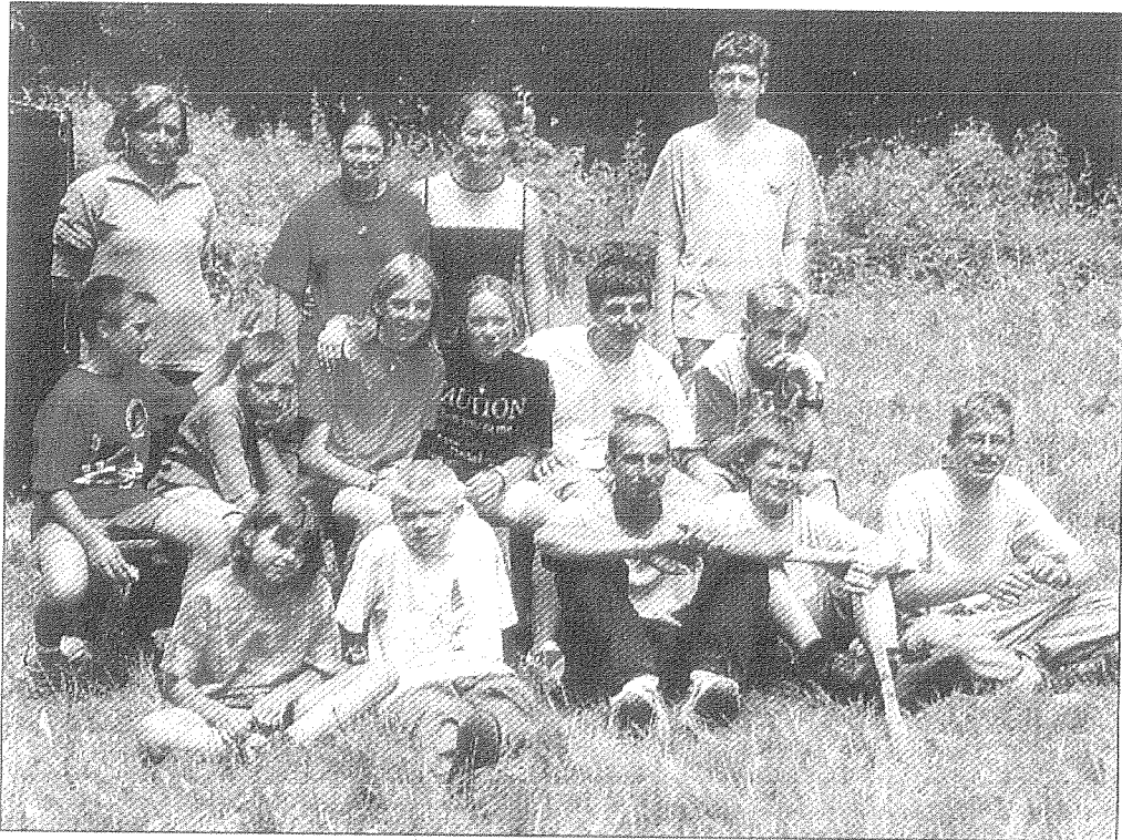
Die Badminton-Jugend des BCK Heimbach-Weis machte sich mit ihren Betreuern auf ins Brexbachtal.

Abwechslungsreiches Programm schweißte Gruppe zusammen